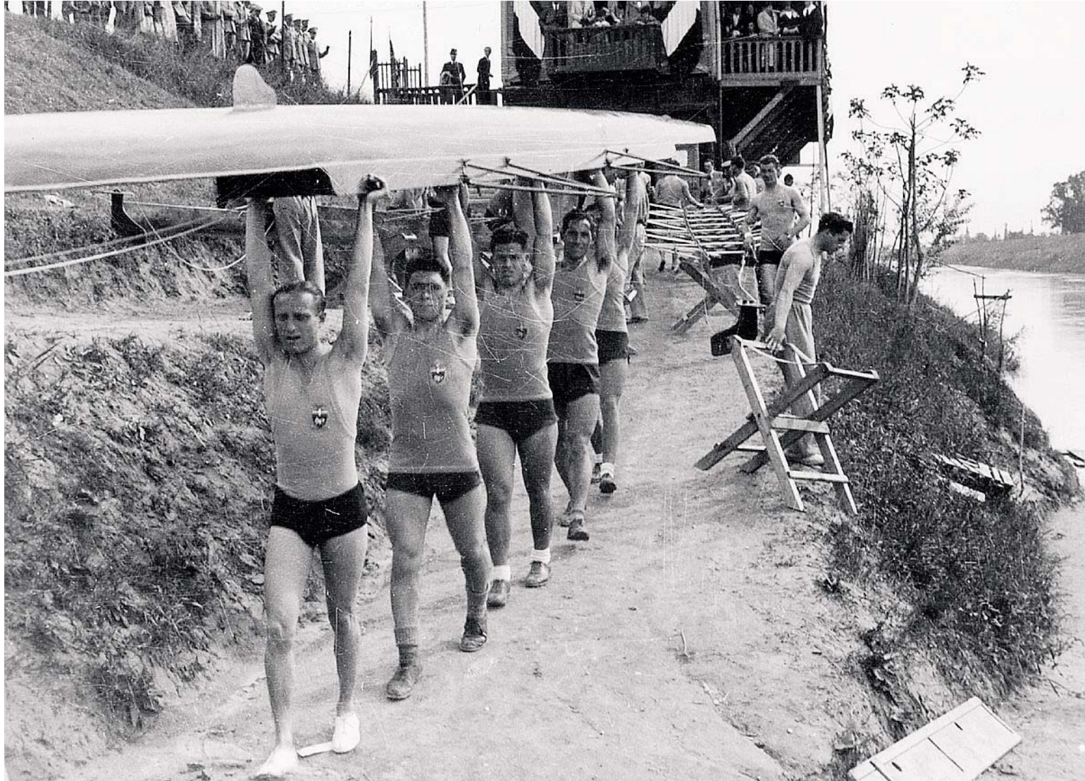
1935 Atleti pronti a scendere in gara sulle sponde del Fiume Secchia nella prima sede della Canottieri Mutina a San Matteo (vicino all'attuale Passo dell'Uccellino)