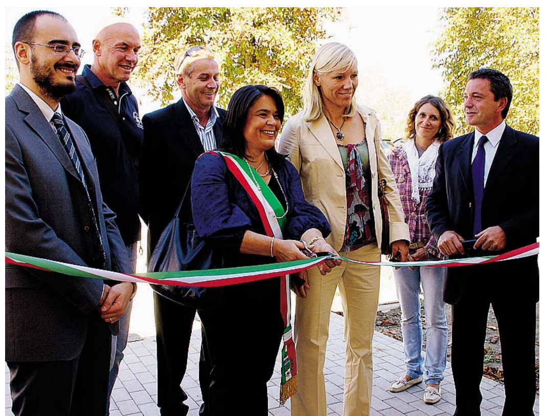
NUOVA SEDE Taglio del nastro all'inaugurazione della nuova sede nel 2010 alla presenza della campionessa Josefa Idem